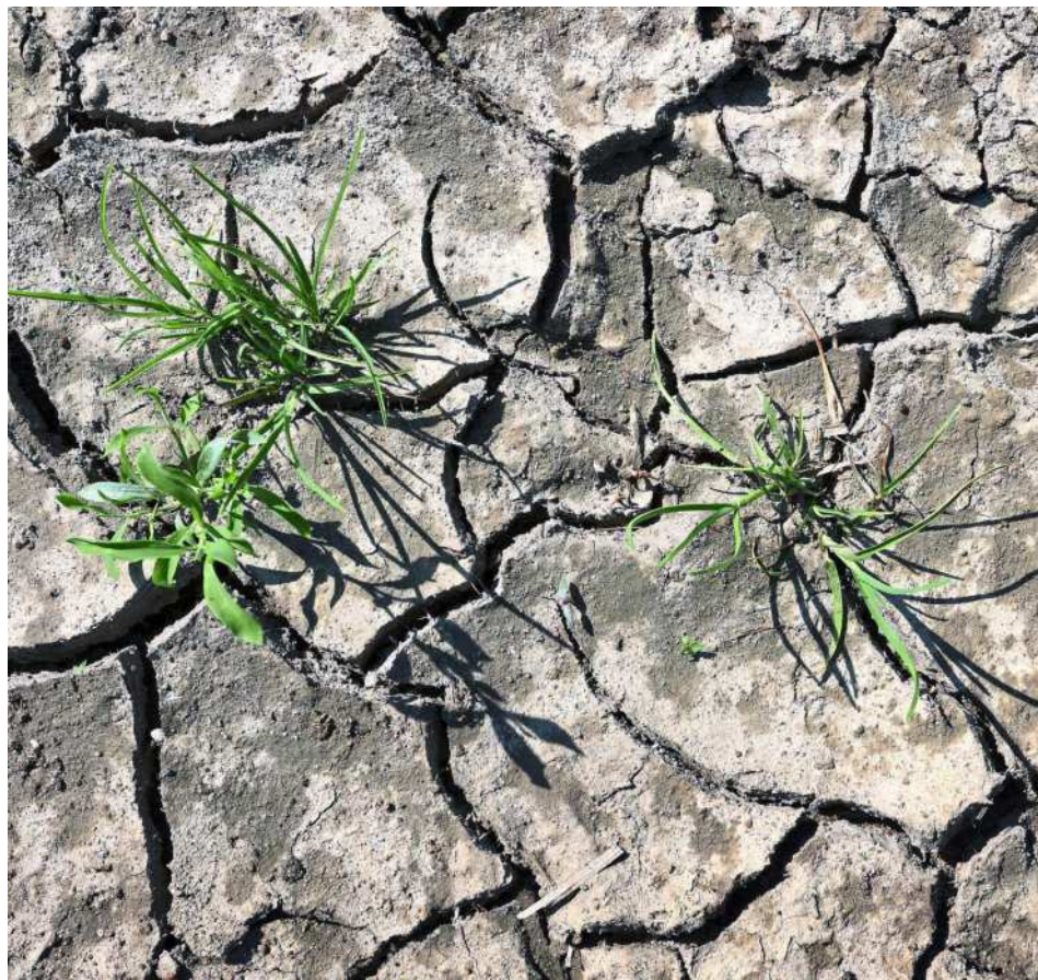
Drängendes Problem: Trotz der jüngsten Hochwasser-Katastrophe in Deutschland bleibt Trockenheit für das Weltklima ein wichtiges Thema.

„Ich habe den Eindruck, dass die Gesellschaft zumindest im Prinzip deutlich bereit für einschneidende Klimamaßnahmen ist als die Politik es wahrnimmt“, sagt Notz. „Sie hört nach meinem Eindruck teilweise noch zu sehr auf einzelne Lobby-Interessen.“